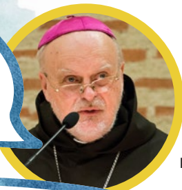
Anders Aborelius, kardinal och biskop i Stockholms katolska stift

Som kristna har vi alla ett uppdrag att bidra till fred, försoning och rättvisa i världen. Som kristna i Europa har vi nu möjlighet att göra en insats för detta genom att rösta i EU-valet. Vår röst är viktig för att stärka enhet och solidaritet mellan alla människor av god vilja i hela Europa. Vi är alla ansvariga för Europas framtid.