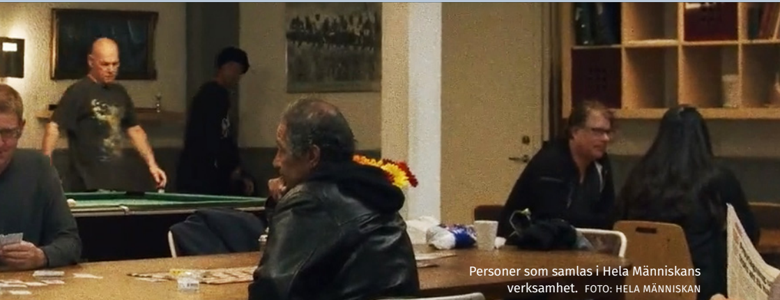
Personer som samlas i Hela Människans verksamhet.