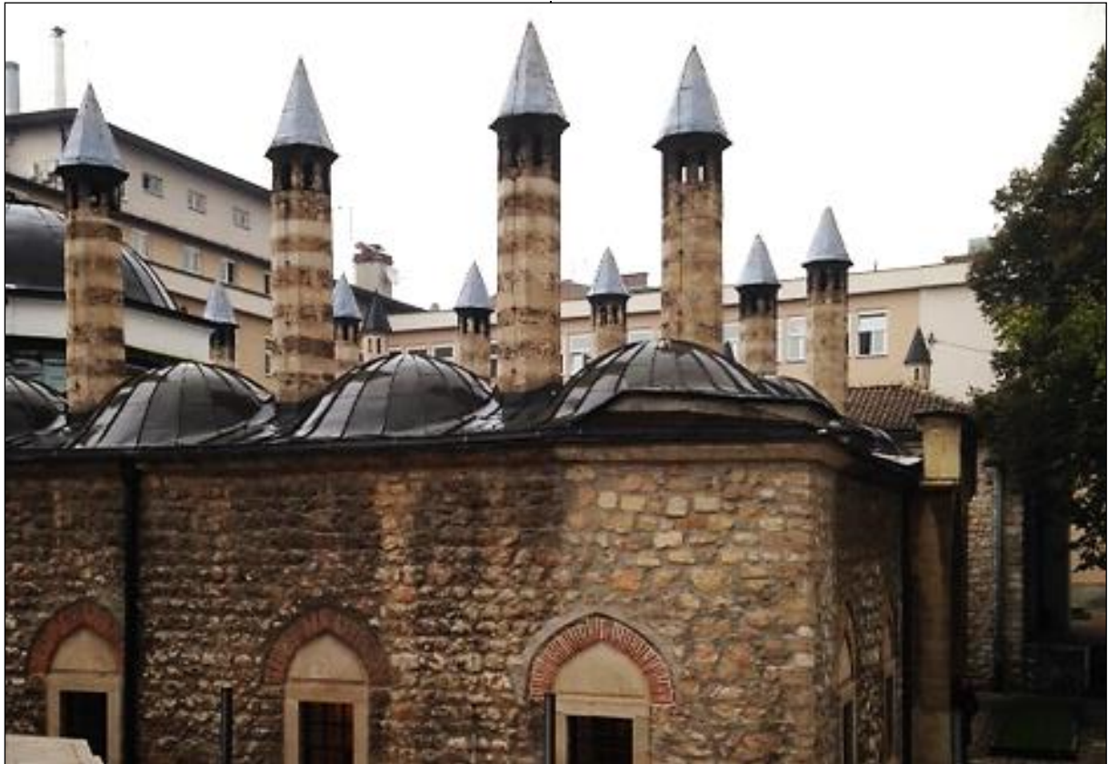
Gazi Husrevbegs gamla medresa grundad på 1530-talet