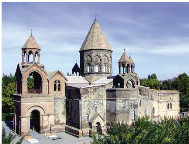
Katedralen i Etchmiadzin utanför Armeniens huvudstad Yerevan

Det armeniska språket med dess olika dialekter, kulturen med rik litteratur och musik och inte minst kyrkan finns bland de identitetsskapande elementen. Den Armeniska apostoliska kyrkan är med självklarhet ett fokus och ser sig som den äldsta ännu existerande nationella kyrkan. Enligt traditionen grundades kyrkan år 301. Vare sig man är ortodox, katolik eller protestantisk armenier ser man kyrkan som den stora andliga kulturbäraren som lik en folkkyrka bevarat folkets identitet. Det armeniska alfabetet har fört bibeln, liturgin och den andliga litteraturen vidare liksom illuminationer och korsstenar skapade i kloster och kyrkor genom årtusenden. Allt detta är ett arv som i dag vårdas och odlas varhelst armenier bor. Ett av de tydligaste uttrycken är de armeniska kyrkorna varav några har rötter i 300-talet, som katedralen i Etchmiadzin utanför Yerevan, armeniernas kyrkliga centrum med